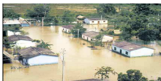
Provoca inundaciones y sequías