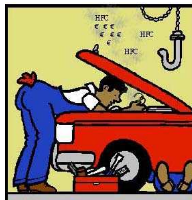
Si deja escapar HCF (R-134a) a la atmósfera perderá dinero

Reglamento (CE) 2037/2000 sobre las sustancias que agotan la capa de ozono Ley 10/1998 de residuos